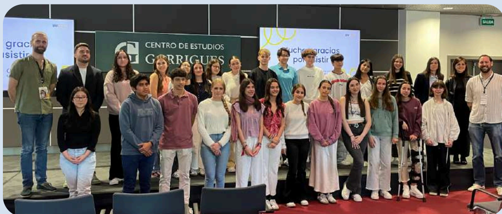
MADRID CEG - DERECHO